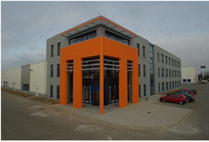
Großansicht per Klick auf Bild!

Daneben verfügt Streiff & Helmold über Werke in Barsinghausen und Halberstadt, in denen Rollenwellpappe erzeugt bzw. die komplette Wellpappverarbeitung untergebracht sind. Eine Besonderheit im Halberstädter Werk ist die neu installierte ENGICO, eine Maschine, die Spezialverpackungen für die Möbelindustrie herstellt und die erste Ihrer Art in der Bundesrepublik ist.