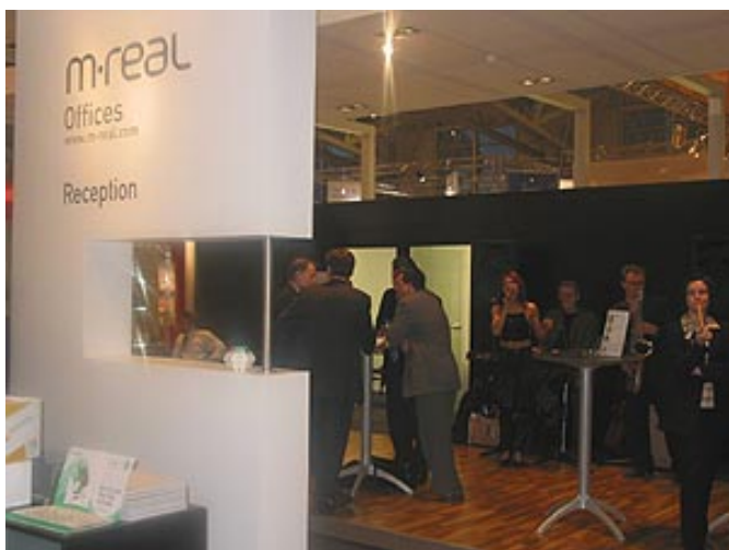
Auf dem Messestand von M-real sorgte Livemusik für angenehme, entspannte Stimmung unter den Besuchern

Die großen Papiererzeuger auf der diesjährigen Frankfurter Messe Paperworld waren nach Gesprächen der apr mit der Qualität der Besucher sehr zufrieden. Nischenanbieter wie die Papierfabrik Gmund zeigten sich vom Messeverlauf sogar begeistert. Weniger positive Stimmen hörte die apr aus der Ecke der Briefumschlaghersteller, aber auch bei den Herstellern von technischen Papieren. Insgesamt ist die Zahl der Besucher der Paperworld nach Angaben der Messe Frankfurt um 4 % auf 69.000 gestiegen. Bei der Messe zeigten 2518 Aussteller (i. Vj.: 2398) ihre Produkte, davon kamen 1903 aus dem Ausland. Die Nettoausstellungsfläche stieg leicht um 2,1% auf 91 277 m 2 . Die meisten ausländischen Aussteller kamen aus China (217), gefolgt von Taiwan (206), Italien (203), Hongkong (143) und Frankreich (103). Zwei Drittel der Aussteller sollen mit der Messe nach internen Erhebungen zufrieden gewesen sein. Bei der Zuteilung der einzelnen Aussteller zu den jeweiligen Hallen fällt auf, dass mittlerweile Firmen wie M-real und Neusiedler im Bereich Imaging in der für den Besucher klimatisch wesentlich angenehmeren Halle 1 untergebracht waren, während z. B. UPM-Kymmene, Soporcel und Arjo Wiggins in Halle 4.1 ausstellten. Eine gemeinsame Platzierung in Halle 1 wäre aus der Sicht mancher Gesprächspartner durchaus wünschenswert.