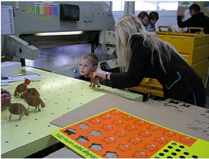
Ein Kleiner - beeindruckt von Pappe