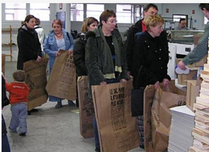
Schüler und Lehrer beim Abholen der Pappe

Abfälle aus der Pappe- und Kartonherstellung kann man stofflich wiederverwerten und in die entsprechende Sekundärfasersammlung geben. Man kann sie aber auch beispielsweise an Grundschulen für deren Werk- und Kunstunterricht verschenken. Diese Idee hat der französische Verband Comité Français de l'Emballage papier-carton (Cofepac) unter dem Titel "Emballage Papier Carton en Fête" (Verpackungspapier und -Karton feiern) erstmals 1998 in die Tat umgesetzt. Sie ist seither zu einer festen Einrichtung geworden, die am 24. März zum siebten Mal stattfand.