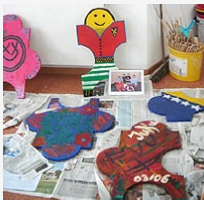
Basteln ist Teil des Unterhaltungsangebots des Reha-Zentrums Katharinenhöhe.