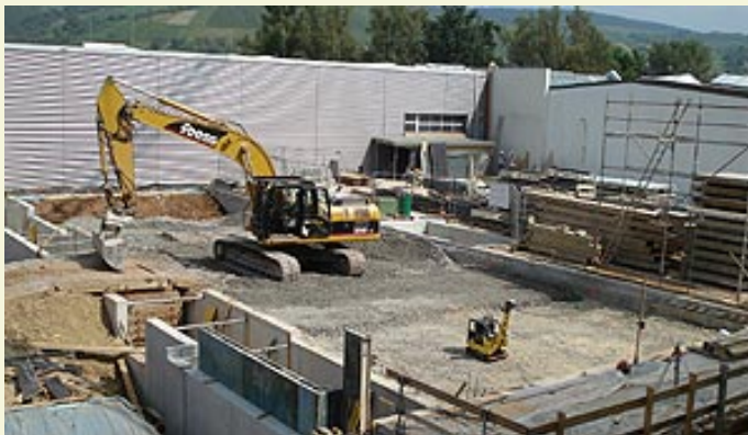
Die Baustelle der neuen Klingele-Produktionshalle in Remshalden-Grundbach.

Die Klingele-Gruppe, Remshalden, möchte in ihrem Stammwerk, Remshalden-Grundbach, in den kommenden zwei Jahren insgesamt 15 Mio. Euro investieren. Geplant ist die Anschaffung einer Faltschachtelklebemaschine des Modells Turbox von der Firma Bahmüller, Plüderhausen, und eines neuen Inliners 13x32 der Firma BGM, Plüderhausen/Wiesentheid. Daneben wird Klingele eine neue Produktionshalle bauen. Den innerbetrieblichen Transport von Bögen zur Weiterverarbeitung von fertigen Produkten übernimmt in naher Zukunft eine Kettenförderanlage, die von der Firma Minda geliefert wird. Mit dem neuen Gebäude steigt die Produktionsfläche um 1300 m 2 . Im abgelaufenen Jahr erzielten die deutschen Firmen der Gruppe mit 950 Mitarbeitern einen Umsatz von ca. 260 Mio. Euro.